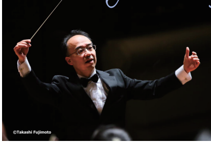
指揮 森口 真司

1964年大阪府生まれ。大阪府立北野高校時代よりオーケストラ活動を始め、京都大学文学部を経て1989年東京藝術大学音楽学部指揮科入学。1995年同大学大学院修了。